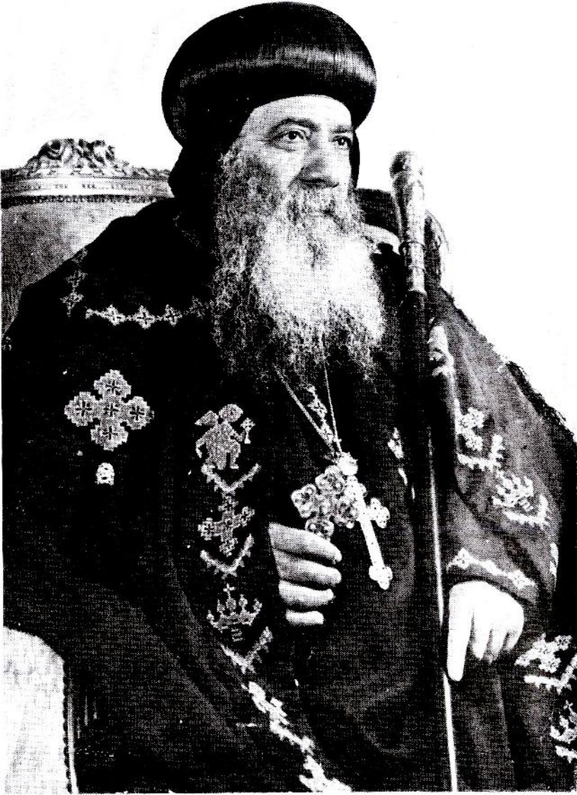
مَثَلُ الطَّوْبِيِّ قَدَّاسَةُ الْبَابَا شَنُودَةُ الثَّلَاثِ بَابَا الْكَسْكَندَرِيَّةِ وَبَطْرِيْرُكَ الْكِرَاذَةُ الْمَرْقَسِيَّةِ ١١٧