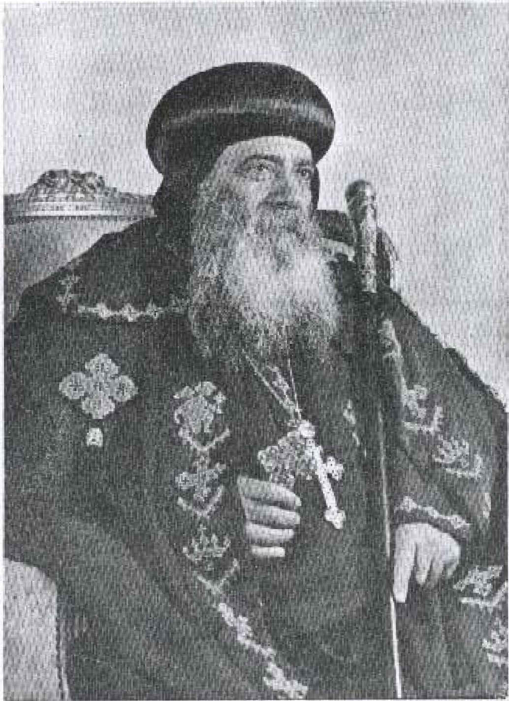
صَاحِبِ القِبْطَةِ وَالقَدَاسَةِ البَيَّابِ المَعظَمِ الأبِيا شُورِهُ الثَّالِثِ بَابَا الإِكْنَديَّةِ وَبَطْرِيكَ الكِرَازَةِ المَرْقِسيَّةِ