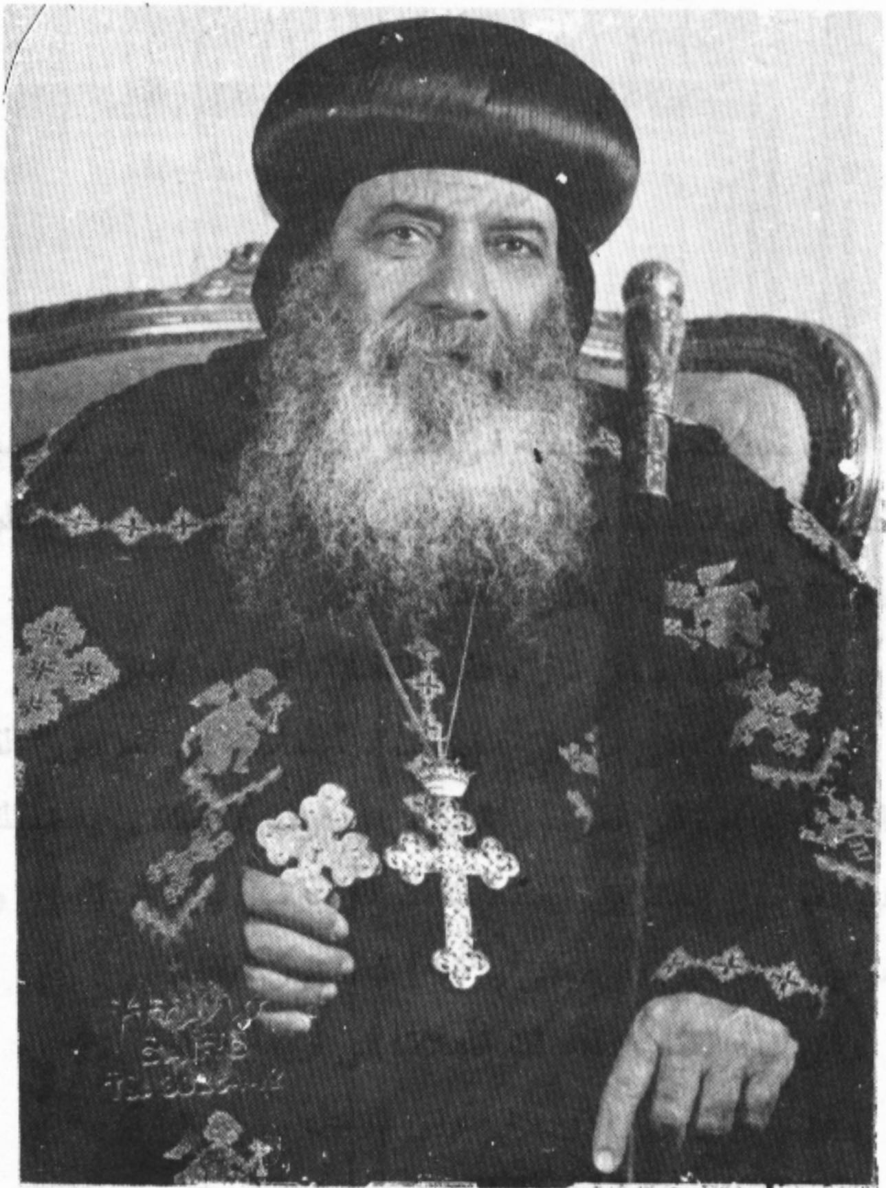
قداسة البابا العظيم البابا سبنورة الثالث