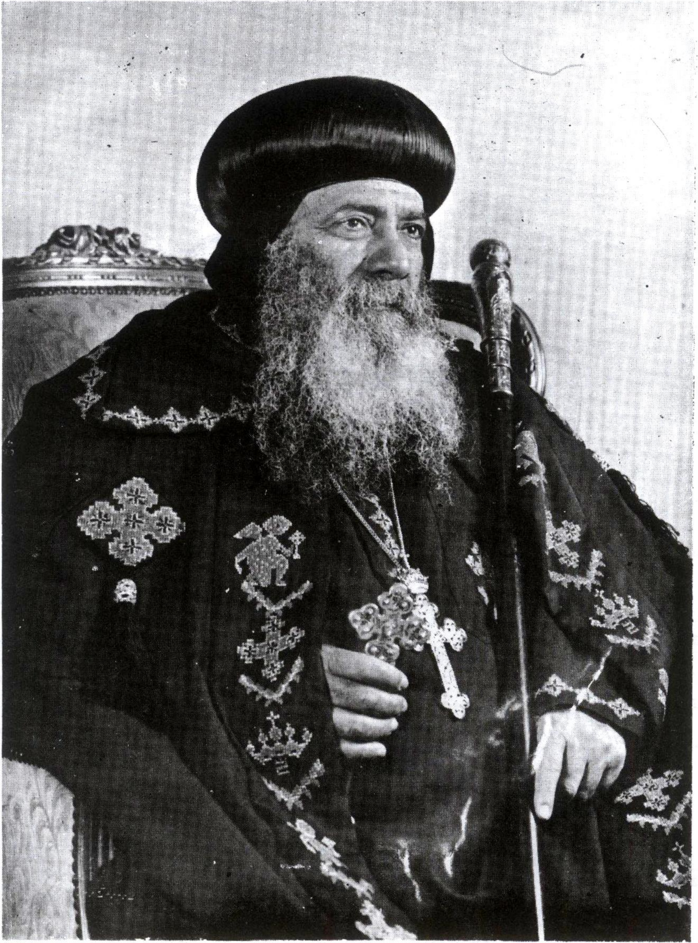
مثلث الطوبى قداسة البابا شنودة الثالث بابا الكسنديرية وبطريك الكرازة المرقسية الـ ١١٧