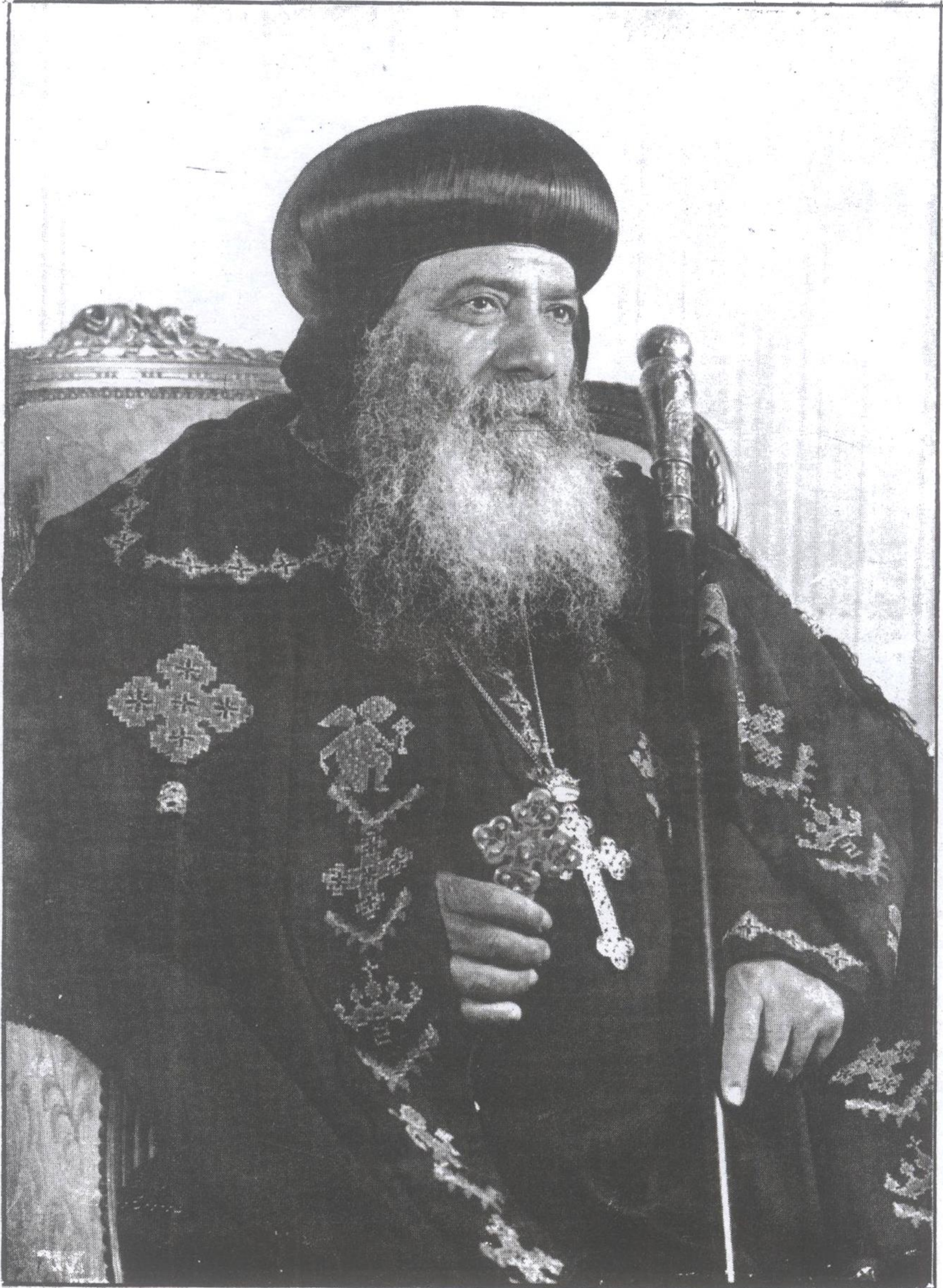
مثلث الطوبى قداسة البابا شنودة الثالث بابا الكسندرية وبطريك الكرازة المرقسية ال ١١٧