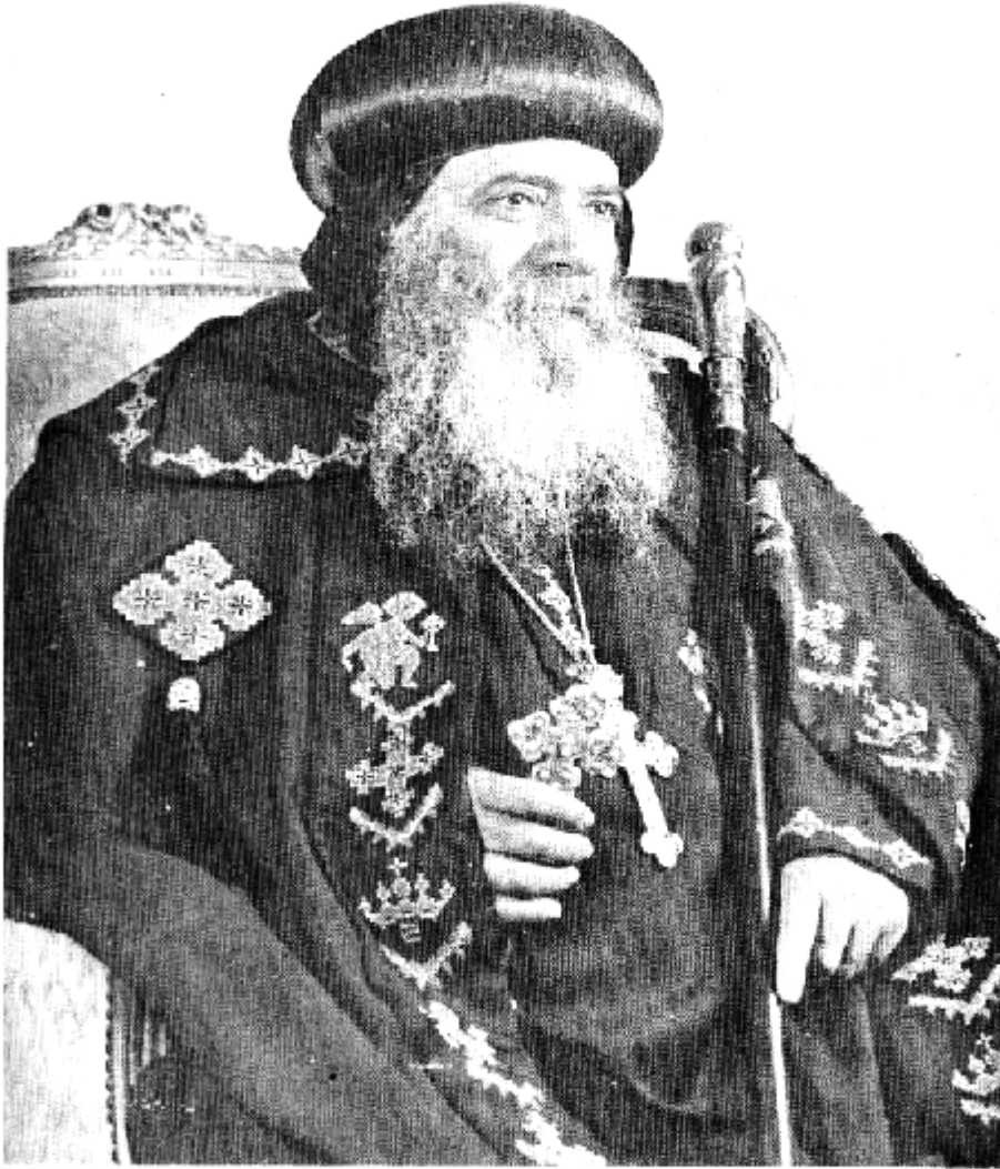
قداسة البابا شنودة الثالث