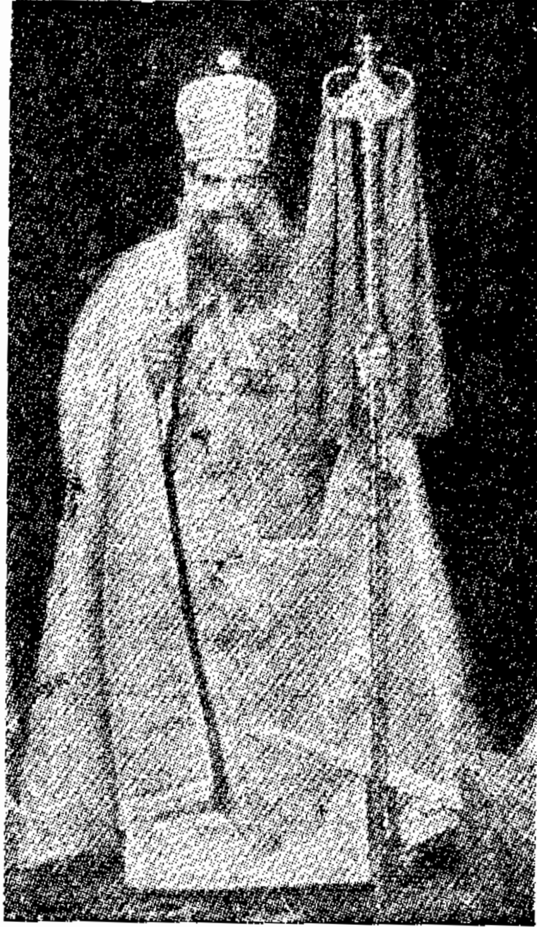
صاحب القداسة البابا كيرلس السادس بابا الاسكندرية وبطريك الكرازة المرقسية